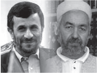
അഹ്മദി നിജാദ്, റാശിദുൽ ഗനുശി

കഴിഞ്ഞ ഹജ്ജിൽ ഏറെ ശ്രദ്ധിക്കപ്പെട്ട വ്യക്തി ഇറാൻ പ്രസിഡന്റ് അഹ്മദി നിജാദായിരുന്നു എന്നു പറയാം. സുഊദി ഭരണാധികാരി അബ്ദുല്ലാ രാജാവിന്റെ ക്ഷണം സ്വീകരിച്ചാണ് അദ്ദേഹം ഹജ്ജിനെത്തിയത്. ഒരു ഇറാനിയൻ പ്രസിഡന്റിന് സുഊദിയിൽനിന്ന് ഹജ്ജിനായി ഔദ്യോഗിക ക്ഷണം കിട്ടുന്നത് ഇതാദ്യമായാണ്. പ്രസിഡന്റായിരിക്കെ ഒരു ഇറാനി പൗരനും ഇതുവരെ ഹജ്ജ് നിർവഹിച്ചിട്ടുമില്ല.