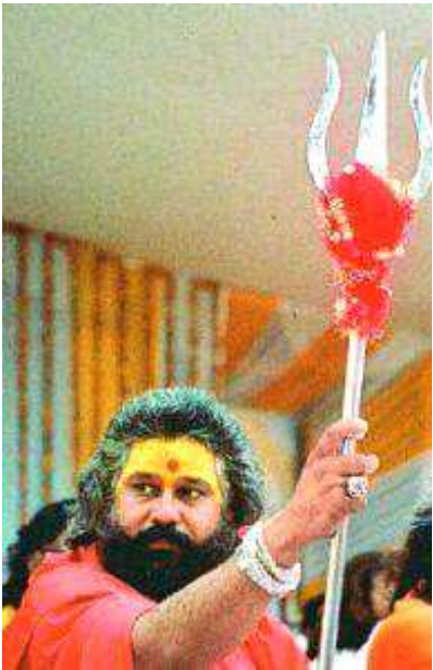
1998 ഡിസംബർ 6-ന് ബജ്റംഗ്ദൾ ഒരു തൃശൂൽ ദീക്ഷാ ആഘോഷം സംഘടിപ്പിച്ചു. അതേവർഷം ഡിസംബർ 25-ന് ക്രിസ്ത്മസ് ദിനത്തിൽ ഹിന്ദുജാഗരൺ മഞ്ച് (HJM) അഹ്വ (Ahva)യിൽ ഒരു റാലി സംഘടിപ്പിച്ചു. ക്രിസ്ത്മസ് ദിനത്തിലെ പ്രാർഥന കഴിഞ്ഞ് വീട്ടിലേക്ക് മടങ്ങുകയായിരുന്ന ക്രിസ്ത്യാനികൾക്കെതിരെ റാലിയിൽ പങ്കെടുത്തവർ ആക്രമണമഴിച്ചുവിട്ടു.

വിഷം വമിക്കുന്നതുമായ ഒട്ടേറെ മുദ്രാവാക്യങ്ങൾ ആദിവാസികളുടെ മനസിലും നാവിലും നിക്ഷേപിക്കാൻ സംഘ്ലപരിവാറിന് സാധിച്ചിട്ടുണ്ട്. ‘രാഷ്ട്രീയ’ പ്രസംഗങ്ങൾ, ‘ആത്മീയ’ പ്രഭാഷണങ്ങൾ, ബുക്ലെറ്റുകൾ, ലഘുലേഖകൾ, സി.ഡികൾ തുടങ്ങി വ്യക്തിഗത സംഭാഷണങ്ങൾ വരെയുള്ള വഴികളിലൂടെയാണ് ആദിവാസി മേഖലകളെ സംഘ്ലപരിവാർ കാവിപുശിക്കാണ്ടിരിക്കുന്നത്. അവയിലൊന്നിൽ അച്ചടിച്ചിട്ടുള്ള വരികളിങ്ങനെയാണ്: “ഹിന്ദുജാഗോ, ക്രിസ്തിബാഗോ” - ഹിന്ദു ഉണരുക, ക്രിസ്ത്യാനിയെ പുറത്താക്കുക (Arise Hindu throw out the Christians). വെറും തത്ത്വപ്രസംഗങ്ങളും മുദ്രാവാക്യം വിളികളും മാത്രമല്ല, സായുധാക്രമണങ്ങൾ