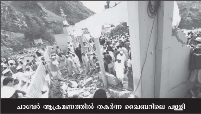
ചാവേർ ആക്രമണത്തിൽ തകർന്ന ഖൈബറിലെ പള്ളി

അടുത്ത കാലത്തായി പാകിസ്താനിലെ പ്രാർഥനാലയങ്ങളിൽ ചാവേറാക്രമണങ്ങൾ വർദ്ധിച്ചിട്ടുണ്ട്. ഏപ്രിൽ ആറിന് വടക്കു കിഴക്കൻ നഗരമായ ചക്വലിലെ ശീഹൂ പള്ളിയിൽ ഒരാൾ സ്വയം പൊട്ടിത്തെറിച്ച് 26 പേരെയാണ് കൊലപ്പെടുത്തിയത്. തൊട്ടുമുമ്പ് അഫ്ഗാനിസ്താനോട് ചേർന്ന ഖൈബറിലെ ഒരു സുന്നി പള്ളിയിലെ സഫോടനത്തിൽ കൊല്ലപ്പെട്ടത് 70 പേർ. തുട