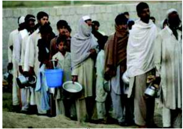
ഭക്ഷണത്തിന് ക്യൂ നിൽക്കുന്ന അഭയാർഥികൾ

1969 ജൂലൈ എട്ട് വരെ സ്വാത് ഒരു നാട്ടുരാജ്യമായിരുന്നു. സയ്യിദ് അക്ബർ ഷാ ആണ് 1849ൽ ‘സ്വാത് ഇസ്‌ലാമിക് സ്റ്റേറ്റ്’ സ്ഥാപിച്ചത്. 1863 മുതൽ 1926 വരെ ഈ ഇസ്‌ലാമിക് സ്റ്റേറ്റ് താൽക്കാലികമായി ഇല്ലാതായെങ്കിലും കോടതി നടപടികൾ ഇസ്‌ലാമിക് ശരീഅത്ത് അനുസരിച്ച് തന്നെയായിരുന്നു. 1926ൽ ബ്രിട്ടീഷുകാർ ഖാദി കോർട്ടുകൾ എന്നറിയപ്പെടുന്ന ശരീഅത്ത് നിയമസംവിധാനം പുനഃസ്ഥാപിച്ചു. 1969ൽ സ്വാത് പാകിസ്താന്റെ ഭാഗമാവുന്നത് വരെ ഖാദി കോർട്ടുകൾ പ്രവർത്തിച്ചു. സുതാര്യമായിരുന്നു ഖാദി കോർട്ടുകളുടെ പ്രവർത്തനം. സാധാരണക്കാർക്ക് എളുപ്പത്തിൽ നീതി ലഭ്യമായിരുന്നു. സ്വാത്