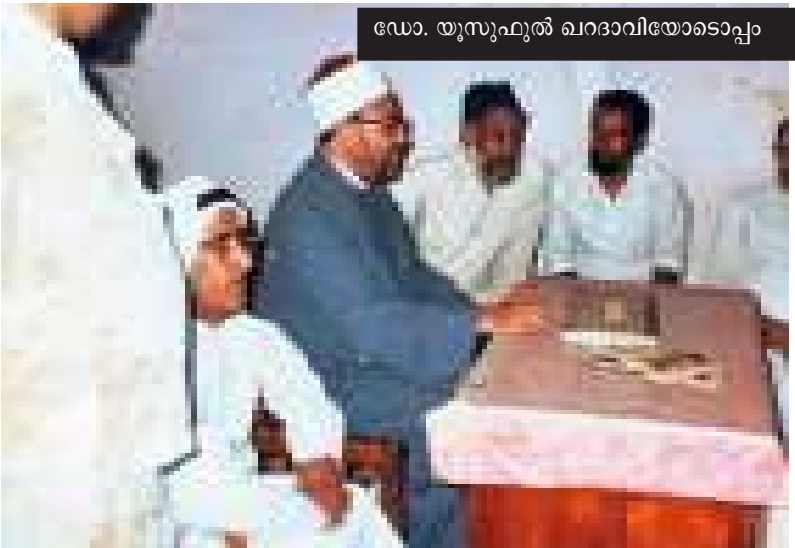
ഡോ. യൂസുഫുൽ ഖദാവിയോടൊപ്പം

ഇസ്ലാമിക പ്രസ്ഥാനത്തിന്റെ വളർച്ചയുടെ നാഴികക്കല്ലായി മാറിയത് 1967ലെ മുവാറ്റുപുഴ ഇസ്ലാമിക് എഡ്യൂക്കേഷൻ ട്രസ്റ്റ് (MIET) രൂപീകരണമായിരുന്നു. മുസ്ലിം സ്ത്രീകളുടെ വിദ്യാഭ്യാസപരവും സാംസ്കാരികവുമായ വളർച്ച ലക്ഷ്യം വെച്ചാണ് ട്രസ്റ്റ് രൂപവത്കരിച്ചത്. ഇപ്പോൾ ട്രസ്റ്റിനു കീഴിൽ വനിതാ ഇസ്ലാമിയ്യാ കോളേജ്, മദ്റസ, പെൺകു