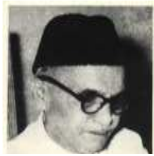
കെ.എം സീതി സാഹിബ്