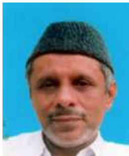
ഹൈദരലി ശിഹാബ് തങ്ങൾ

കാലശേഷം പാർട്ടി നേതൃത്വം എങ്ങനെയാവും നേരിടുക എന്നും കാത്തിരുന്നു കാണാം. മതനിരപേക്ഷ ജനാധിപത്യ ക്രമത്തോട് കണിശമായ ആഭിമുഖ്യം പുലർത്തിയപ്പോഴും അൽ അസ്ഹർ യൂനിവേഴ്സിറ്റിയുടെ സന്തതയായ സയ്യിദ് മുഹമ്മദലി ശിഹാബ് ഇസ്ലാമിനെക്കുറിച്ചു തന്റെ കാഴ്ചപ്പാട് വളച്ചുകെട്ടില്ലാതെ വ്യക്തമാക്കിയിട്ടുണ്ട്. “മനുഷ്യന്റെ വ്യക്തി-സാമൂഹിക ജീവിതത്തിൽ നിഖില മേഖലകളെയും സ്പർശിക്കുന്നതാണ് ഇസ്ലാം. ജീവിതയാത്രയുടെ ഒരു സന്ധിയിലും ശങ്കിച്ചു നിൽക്കേണ്ടതില്ലാത്തവിധം ഇസ്ലാം എന്ന സമഗ്രപദ്ധതി വിശ്വാസികൾ വഴികാട്ടുന്നു. ആരാധനയിലും ആചാരാനുഷ്ഠാനങ്ങളിലും വ്യക്തിയുടെ ദൈനംദിന ദാമ്പത്യത്തിന്റെ സ്വകാര്യതയിലും കുടുംബ-സാമൂഹികബന്ധങ്ങളിലും വിനിമയങ്ങളിലും സമ്പത്തിന്റെ ശേഖരണത്തിലും വ്യയത്തിലും തുടങ്ങി രാഷ്ട്രീയത്തിലും ഭരണത്തിലും വരെ പാലിക്കേണ്ട നീതിശാസ്ത്രവും രീതിമര്യാദകളും വ്യവസ്ഥ ചെയ്തിരിക്കുന്ന ഇസ്ലാമിനെ ഓരോ കർമ്മത്തിലും മുൻനിർത്തിയാൽ ജീവിത വിശുദ്ധിയും വിജയവും കൈവരിക്കാനാകും. ഇസ്ലാം എന്ന സമ്പൂർണ്ണ തത്ത്വസംഹിത സമസ്തകാലത്തിനും സമസ്ത സമൂഹത്തിനുമുള്ള സന്ദേശവും തിരുത്തലുകൾക്കും കൂട്ടിച്ചേർക്കലിനുമതീതവുമാണ്. ഭൗതിക, പാരത്രിക വിജയത്തിന്റെ സിദ്ധാന്തവും പ്രയോഗവുമായ ഇസ്ലാം മനുഷ്യനന്മയെന്ന മഹാലക്ഷ്യവുമായി ലോകത്തിനു വെളിച്ചം പകരുന്നു. അധർമ്മം നിർമാർജ്ജനം ചെയ്യാനും ധർമ്മം സംസ്ഥാപിക്കാനും നിയോഗിക്കപ്പെട്ട ആദാനബി മുതൽ മുഹമ്മദ് നബി വരെയുള്ള പ്രവാചകന്മാരുടെ ദൗത്യം ദൈവിക സന്ദേശം മനുഷ്യകുലത്തിനു പകരുകയായിരുന്നു. ഓരോ കാലത്തിനും ജനതക്കുമായി പ്രവാചകന്മാർ വന്നു വെങ്കിലും അന്ത്യപ്രവാചകൻ മുഹമ്മദ്