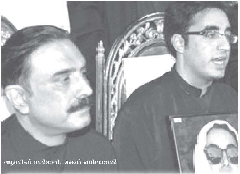
ആസിഫ് സർദാരി, മകൻ ബിലാവൽ

അഴിമതി, വരേണ്യ സ്വഭാവമുള്ള രാഷ്ട്രീയം, യാങ്കിമ്രമുള്ള സൈനിക ഭരണം ഈ മുന്നിനോടുമുള്ള വിയോജിപ്പ് പാകിസ്താനിൽ ശക്തമാണ്. ഇതുപക്ഷേ, വിജയത്തിലെത്താൻ സമയമെടുക്കും. ഇസ്ലാമാബാദ് ലാൽ മസ്ജിദ് സംവേദത്തിൽ കൊല്ലപ്പെട്ടും മുമ്പ് അബ്ദുറാശിദ് ഖാദി പറഞ്ഞതും സാമൂഹികനീതിയിലേക്ക് പാകിസ്താനെ എത്തിക്കാതെ ആർക്കും രക്ഷയില്ലെന്നാണ്.