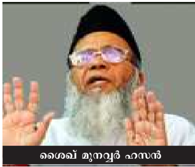
ശൈഖ് മുനവ്വർ ഹസൻ

മാർഷൽ ലോക്കെതിരായ സമരം നയിച്ച മുനവ്വർ ഹസൻ പലതവണ ജയിലിലടക്കപ്പെട്ടു. 1963-ൽ കരാച്ചിയിൽ ഇസ്ലാമിക് റിസർച്ച് അക്കാദമിയിൽ റിസർച്ച് അസിസ്റ്റന്റായി ചേർന്നു. 1969-ൽ അതിന്റെ സെക്രട്ടറി ജനറലായി. അദ്ദേഹത്തിന്റെ മേൽനോട്ടത്തിൽ അക്കാദമി 70