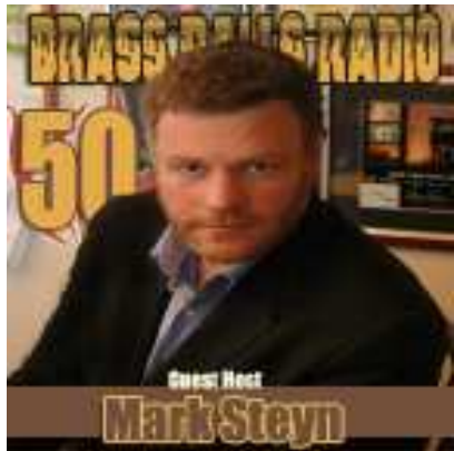
● മാർക് സ്റ്റെയിൻ

War, Anchor Books, New York, 2001, Page 270). മറ്റൊരിക്കൽ യുദ്ധത്തിനിടെ റിച്ചാർഡിന്റെ കുതിര വീഴുന്നതു കണ്ട സലാഹുദ്ദീൻ അയ്യൂബി ഇംഗ്ലണ്ടിന്റെ ധീരനായ രാജാവിന് വേണ്ടി തന്റെ സ്വന്തം കുതിരക്കാരനെ രണ്ട് പുതിയ കുതിരകളുമായി അയച്ചുകൊടുക്കുകയുമുണ്ടായി (അതേ പുസ്തകം, പേജ് 271). ആശയപരമായോ അല്ലാതെയോ യുദ്ധത്തിലേർപ്പെടുമ്പോഴും ഇത്തരം മൂല്യങ്ങൾ ഉയർത്തിപ്പിടിക്കാനാവുമെന്നാണ് സലാഹുദ്ദീൻ അയ്യൂബി കാണിച്ചു തന്നത്. മറ്റൊരിക്കൽ റിച്ചാർഡ് വേഷം മാറി സലാഹുദ്ദീന്റെ കൂടെ ഭക്ഷണം കഴിക്കാൻ വന്ന സംഭവവുമുണ്ട്. ഭക്ഷണം കഴിച്ചുകൊണ്ടിരിക്കെ, താങ്കൾ ഇംഗ്ലണ്ടിലെ രാജാവ് റിച്ചാർഡിനെക്കുറിച്ച് എന്ത് കരുതുന്നു എന്ന് റിച്ചാർഡ് ചോദിച്ചപ്പോൾ സലാഹുദ്ദീൻ പറഞ്ഞു: “വീരഭടന്റെ ശൗര്യമുണ്ടെങ്കിലും യുദ്ധരംഗത്ത് അമിതമായ തിടുക്കം കാണിച്ച് അതദ്ദേഹം നശിപ്പിച്ചു കളയുന്നു.” ശൗര്യഗുണത്തിൽ റിച്ചാർഡിനേക്കാൾ സലാഹുദ്ദീനായിരുന്നു മുമ്പിലെന്ന് ഈ സംഭവം കാണിച്ചു തരുന്നു. മസ്ജിദിൽ അഖ്സയുടെ മുമ്പിൽ ചെന്ന് കണ്ണുനീരൊഴുക്കി പ്രാർഥിച്ച ശേഷം രണാങ്കണത്തിലിറങ്ങിയിരുന്ന സലാഹുദ്ദീൻ അയ്യൂബിയെ ചരിത്രം ഇന്നും ഓർക്കുന്നത് ഇത്തരം മഹത്തായ ഗുണങ്ങൾകൊണ്ടാണ്. സ്വന്തം സമൂഹത്തിൽ, മതത്തിൽ, ഒരേ സംഘടനയിൽ