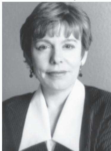
● കരൻ ആംസ്ട്രോങ്ങ്

വീടുകളിൽ നിന്ന് ആട്ടിയോടിക്കപ്പെട്ടതും. വിശ്വസിക്കാനാവാത്ത പലതും നടന്ന രാജ്യമാണ് ഫ്രാൻസ്. ലോകപ്രശസ്ത ചിന്തകനായിരുന്ന വോൾട്ടയെ തുറുങ്കിലടക്കുകയും പിന്നീട് നാട് കടത്തുകയും ചെയ്ത നാടാണത്. ഓക്സിജൻ കണ്ടുപിടിച്ച ലാവോയിസിയർ (Lavoisier) എന്ന രസതന്ത്രജ്ഞനെ രാജ്യദ്രോഹി എന്ന് മുദ്രകുത്തി വിപ്ലവാനന്തരം പ്രഭുക്കളും സാധാരണക്കാരുമടങ്ങുന്ന രണ്ടായിരത്തി അറുനൂറ് പേരോടൊപ്പം കൊന്നു കളഞ്ഞ രാജ്യമാണ് ഫ്രാൻസ്. അന്ന് അതിന് നേതൃത്വം നൽകിയത് വിപ്ലവാനന്തരം അധികാരം കൈയടക്കിയ, മനുഷ്യാവകാശങ്ങൾക്ക് പ്രാധാന്യം കൊടുക്കുന്നവനെന്ന് സ്വയം വിശേഷിപ്പിച്ച തീവ്ര ഇടതുപക്ഷക്കാരനായിരുന്ന മാക്സ് മിലിയർ റോബ്സ്പിയർ ആയിരുന്നു. വിപ്ലവത്തിന്റെ പേരിൽ അരങ്ങേറിയ ക്രൂരതകൾക്ക് സഹിഷ്ണുത വഴിമാറിക്കൊടുക്കേണ്ട സ്ഥിതി വന്നു അവിടെ. എല്ലാ അധികാരങ്ങളും ജനങ്ങൾക്ക് എന്ന സ്വപ്നവുമായി തുടങ്ങിയ വിപ്ലവം വഴിതെറ്റി എല്ലാ അധികാരങ്ങളും റോബ്സ്പിയർക്ക് എന്ന നിലയിലെത്തി.