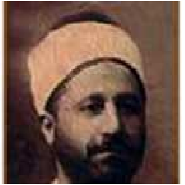
■ റശീദ് റിദാ